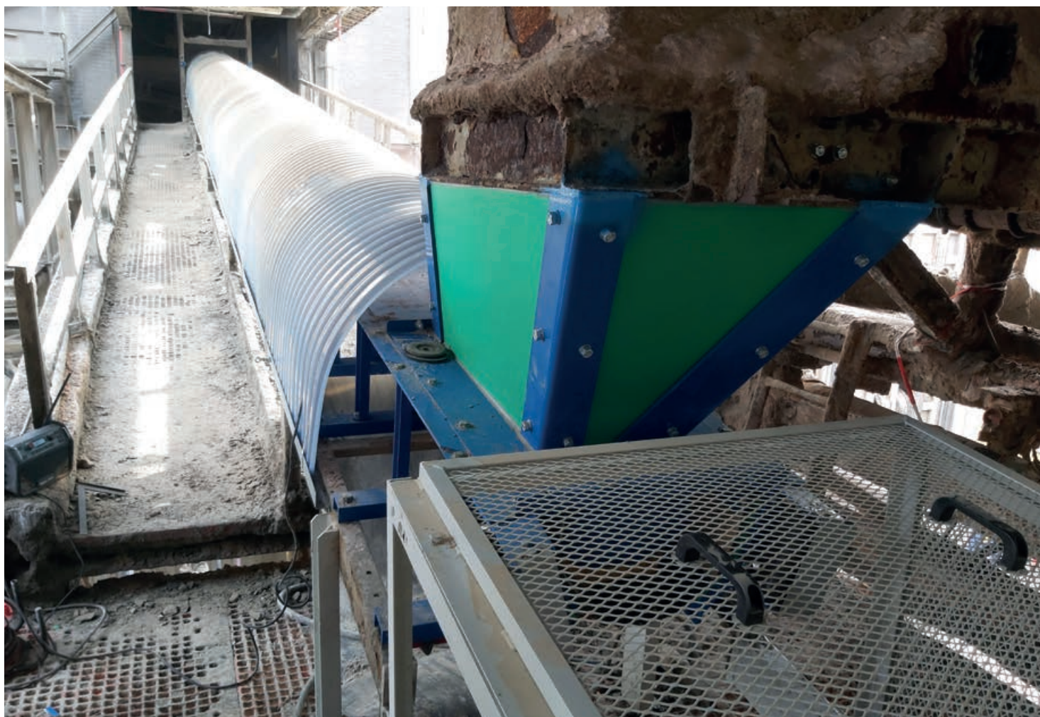
Afb. 1 De Promati Proload bandoverstort voorkomt mors

ICL Fertilizers bevindt zich in de haven van Amsterdam en kampte met een morsende transportlijn voor fosfaatkorrels die overlast veroorzaakte. De korrels koekten vast aan de installatie, waardoor overmatige slijtage optrad. Ook raakte de werkvloer sterk vervuild, waardoor deze frequent geveegd en gereinigd moest worden.